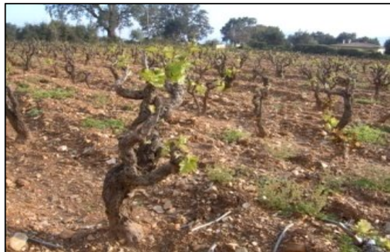
Sistema ad alberello

È il vitigno rosso più diffuso della Sardegna. Gradazione minima 12,5°, di colore rosso rubino con spiccata tendenza al granato, profumo intenso con leggere note spezziate che ricorda le prugne mature, le more, i frutti di bosco.