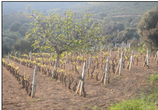
Sistema a Guyot